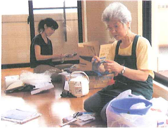
電化製品は、説明書を見ながら、設置。