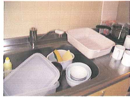
食器類、台所用品は、消毒してから、収納。