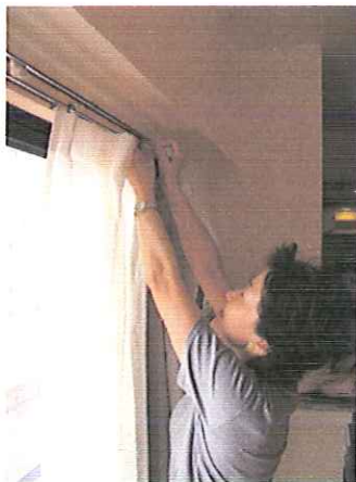
ベージュと、レースのカーテンをかけるととても温かなお部屋になりました。